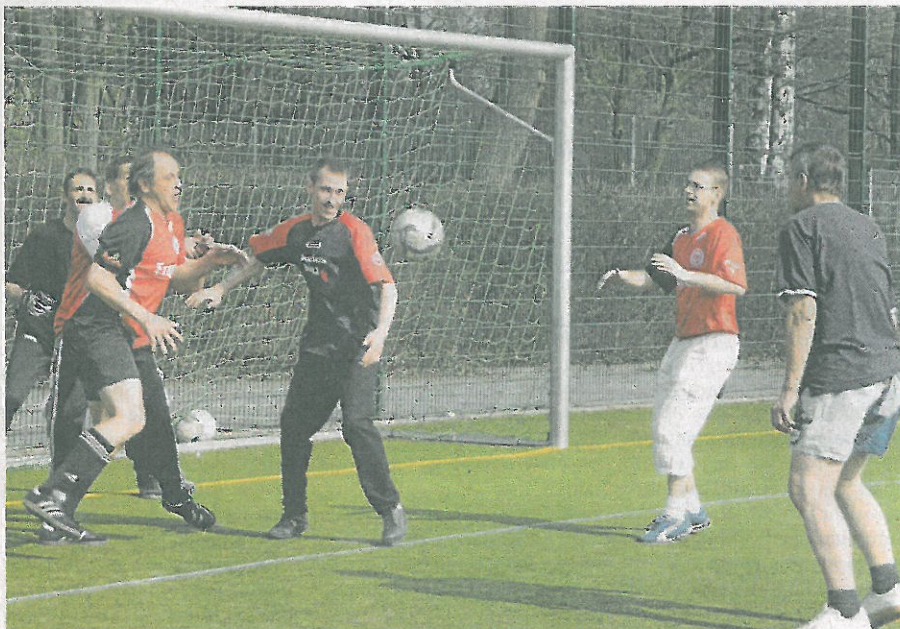
Die Lilien-Kicker sind beim Training in Erbenheim mit Begeisterung bei der Sache.

Und das hoffentlich dann auch im kommenden Sommer in Wiesbaden, denn die Motivation ist groß, beim „Heimspiel“ den Pokal in Händen halten zu wollen.